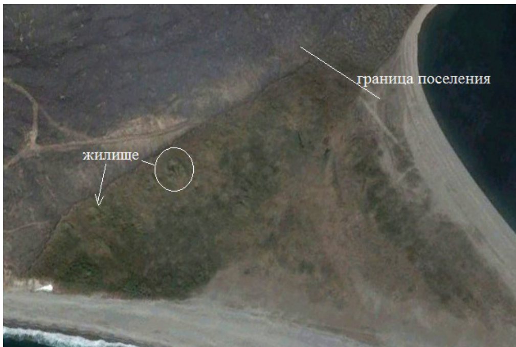
Рис. 2. Поселение Аван. Снимок со спутника NASA 3.07.2005, высота 590 м

Необходимо изучать фитоценозы, сформировавшиеся на древних поселениях эскимосов, т.к. растительный покров обеспечивает сохранность древних памятников культуры и наследия Чукотки- замедляет эрозию, но одновременно нарушает искривляет особенности структуры жилищ.